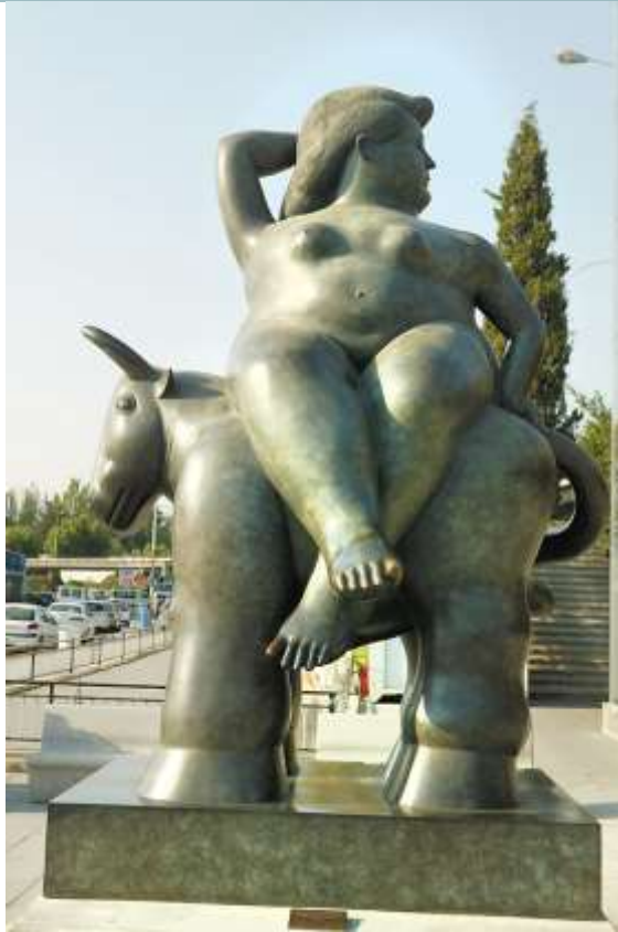
Fernando Botero, Porwanie Europy, 1992