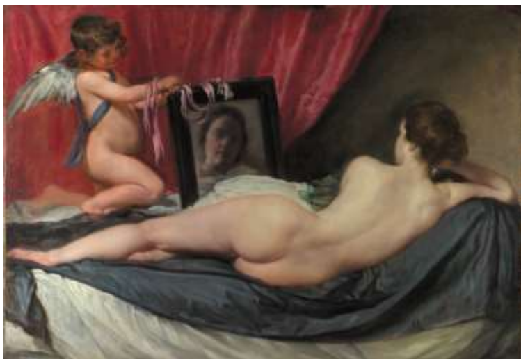
Diego Velázquez, Wenus ze zwierciadłem, ok. 1650

Sztuka baroku trudna jest do jednoznacznego scharakteryzowania przede wszystkim dlatego, że występuje w niej wiele kontrastujących ze sobą zjawisk. Przykładem może być sposób przedstawienia postaci ludzkiej. Z jednej strony z barokiem nierozłącznie kojarzą się kobiety z obrazów Rubensa o wybujałych kształtach, z drugiej zaś ascetyczne, jak gdyby rozciągnięte w pionie, postacie z obrazów El Greca. Generalnie jednak sztuka baroku to sztuka skrajności, wyolbrzymienia (hiperbolizacji) i deformacji. Widać w niej przepych, okazałość, rozmach, bogactwo, dynamizm, dekoracyjność, oryginalność, żywiołowość,