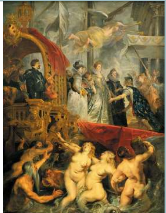
Peter Paul Rubens, Przybycie Marii Medycejskiej do Marsylii, ok. 1622–1625

Realne zdarzenie rozgrywa się na drugim planie, podczas gdy pierwszy wypełniają postacie mitologiczne, ochraniające królewski statek w drodze do Marsylii: Neptun, trytony (pół ludzie, pół ryby) i nereidy (nimfy morskie). Nad schodzącą z pokładu Marią unosi się Fama (bogini wieści), która dmie jednocześnie w dwie trąby.