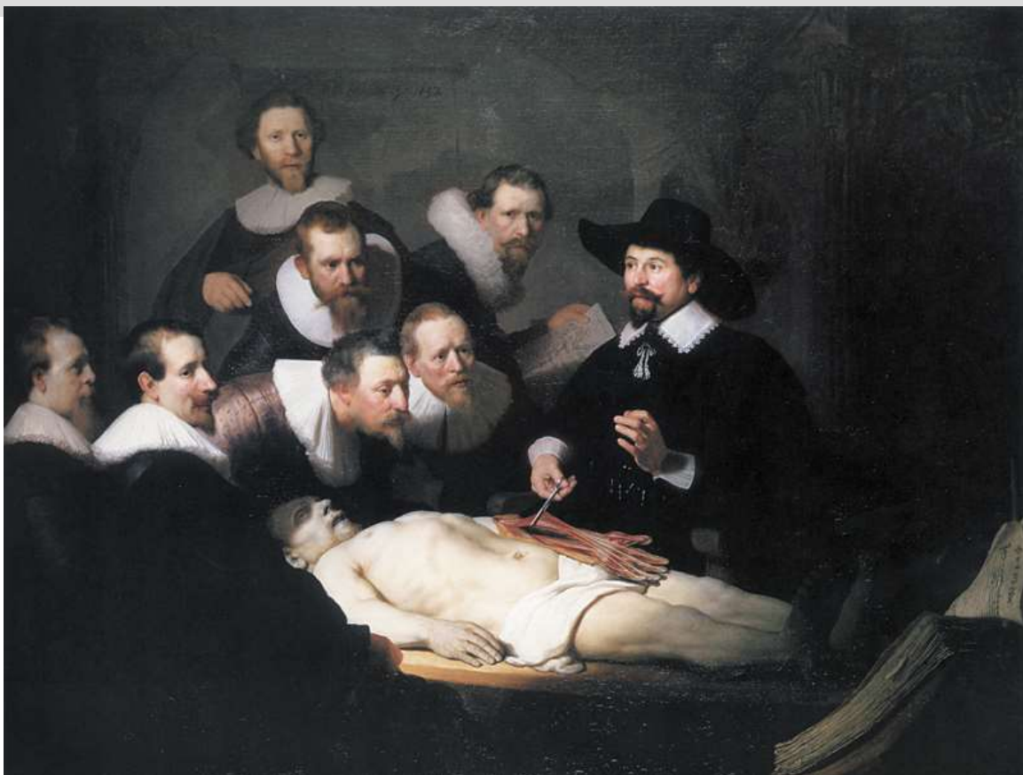
Lekcja anatomii doktora Tulpa – obraz namalowany w 1632

Rembrandt Harmensz van Rijn (1606–1669) – holenderski malarz i grafik. Jeden z największych artystów w dziejach sztuki, mistrz światłocienia, twórca umiejący zajrzeć w głąb ludzkiej duszy. Sławę wśród współczesnych zawdzięczał Lekcji anatomii doktora Tulpa, będącej zbiorowym portretem studentów obserwujących sekcję zwłok. Stał się wziętym portrecistą, otrzymującym wiele zamówień. Początkowo dzieła jego cechowało dramatyczne napięcie, jednak prace późniejszego okresu twórczości są coraz spokojniejsze i bardziej uduchowione. W roku 1642 powstał sławny obraz zwany Straż nocna (Wymarsz strzelców), stanowiący punkt zwrotny w twórczości Rembrandta od silnego realizmu do swoistego wizjonerstwa i mistycyzmu. Obok portretów malował obrazy o tematyce biblijnej oraz pejzaże. Pozostawił po sobie ok. 300 obrazów olejnych oraz ponad 300 grafik.