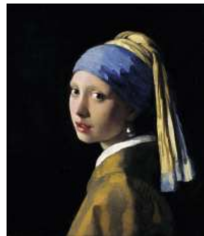
Johannes Vermeer van Delft, Dziewczyna z perłą (Dziewczyna z perłowych kolczykach), ok. 1665

indywidualizm, subiektywizm. Twórcy tej epoki lubowali się w stwarzaniu iluzji (malarstwo). W baroku można obserwować dążenie do syntezy sztuk. Najpełniej realizowała się ona w operze, gdzie bogata scenografia miała w sobie elementy architektury, malarstwa i rzeźby, a partie wokalne wykonywane przez śpiewaków łączyły muzykę, tekst literacki i teatralne środki wyrazu.