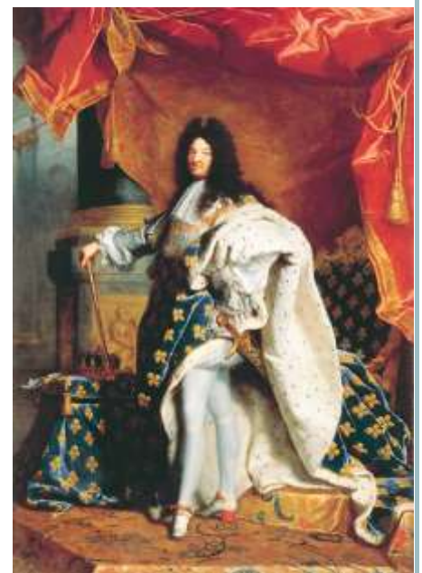
Hyacinthe Rigaud, Portret Ludwika XIV, 1701