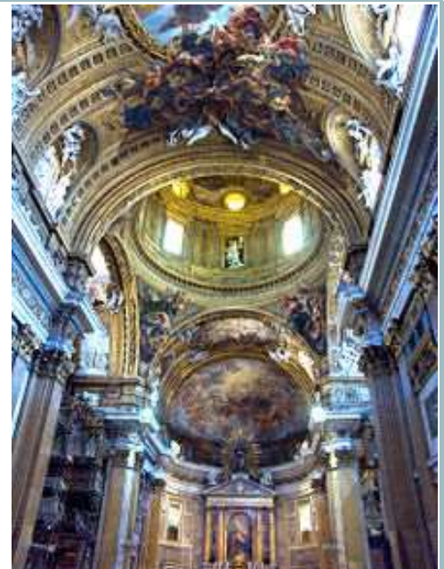
Wnętrze kościoła Il Gesù (Jezus) w Rzymie, 1568–1584

Macierzysta świątynia zakonu jezuitów w Rzymie stała się prototypem wielu kościołów katolickich budowanych po soborze trydenckim.