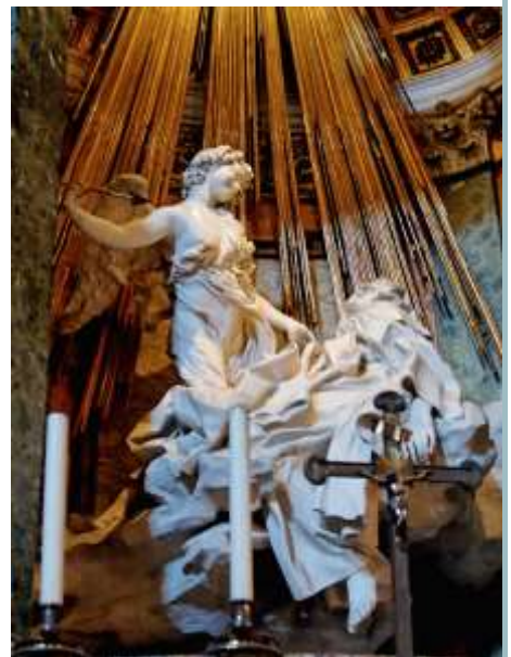
Giovanni Lorenzo Bernini, Ekstaza św. Teresy, 1647–1652

Słowo barok pochodzi od portugalskiego barocco oznaczającego rzadką, cenną perłę o nieregularnym kształcie lub od terminu oznaczającego w dawnej logice rodzaj błędnego rozumowania. Jest to nawiązanie do charakteru epoki, której zarzucano barbarzyństwo i wypaczenie kanonów sztuki. Jednak w języku francuskim baroque oznacza także bogactwo zdobnictwa.