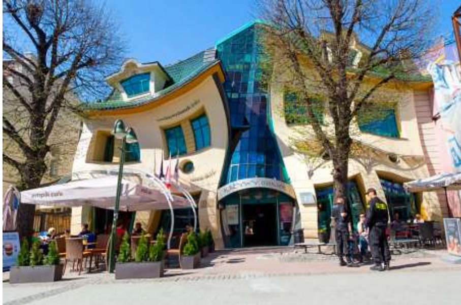
„Krzywy dom” w Sopocie, 2004