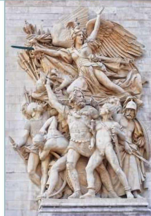
François Rude, Marsylianka (Wymarsz ochotników w 1792 r.), 1833–1835