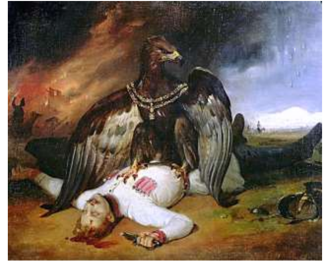
Horace Vernet, Polski Prometeusz , 1831